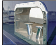
Ferrure en acier spécial dans bordé en alu

TIKAL TEF-GEL® est une pâte à base de PTFE résistante à l'eau qui empêche l'oxydation du métal et qui empêche efficacement la corrosion due aux flux galvaniques entre différents métaux. Partout où des métaux nobles sont en contact direct avec des métaux moins nobles (par ex. aluminium avec acier spécial), une faible quantité de TIKAL TEF-GEL® suffit déjà pour empêcher l'échange galvanique d'électrons et la corrosion qui en résulte.