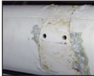
Mât en alu corrodé