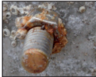
Vis en VA corrodée dans surface en alu