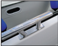
Ferrure en acier spécial sur coque en alu